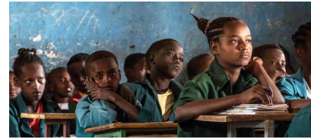
Quello nimmt am OVC-Programm teil. Sie ist 13 Jahre alt. Sie möchte Ärztin werden.

Fundación Pablo Horstmann hat ein Programm entwickelt, welches Waisenkinder und Pflegefamilien nach ihren individuellen Bedürfnissen unterstützt. Ein Team aus zwei Sozialarbeiter und einem Koordinator hilft diesen Familien und überwacht die Fortschritte der Kinder in der Schule. Neben der Kleidung, Nahrung und Hygieneprodukten stehen alle sechs Monate medizinische Untersuchungen für die Waisenkinder in der Pablo Horstmann Klinik „Let Children Have Health“ auf dem Programm. Zusätzlich werden Pflegefamilien beraten und mit Lebensmitteln versorgt.